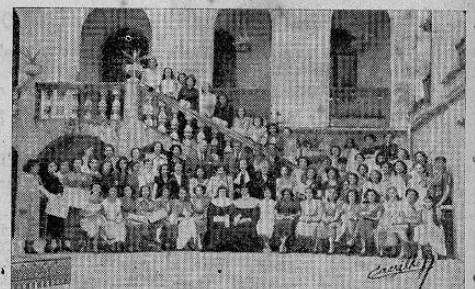
Grupo de Graduadas y sus Profesores en la Tercera Graduación de la Academia.

Es verdaderamente digno de encomio el entusiasmo creciente de la mujer costarricense por capacitarse debidamente para lograr, por derecho propio su independencia, y así la vemos bien en las aulas universitarias, bien en las escuelas comerciales de enfermería, y ahora en la Academia Fe-