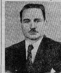
Don Gonzalo Jiménez Flores Ministro de Obras Públicas